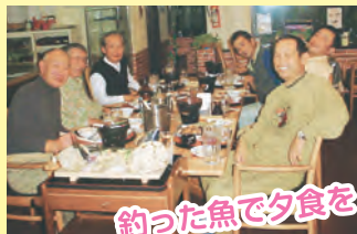
釣った魚で夕食を