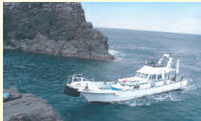
瀬渡し船ビーナスⅡ

当ホテルはレジャー用品の販売や自社の大型クルーザーでの船釣り磯釣りなど「釣り」の事ならあらゆるニーズに対応します また釣り用品・レジャー用品等のレンタルもごさいますので手ぶらでも安心です